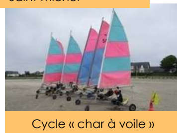
Cycle « char à voile »