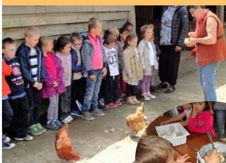
Sortie à la ferme du « Moulin du Bois »