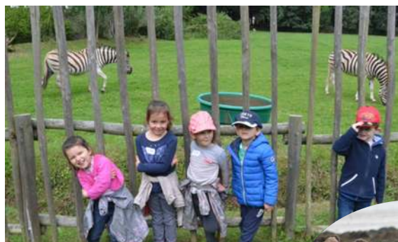
Sortie au Zoo de la Bourbansais