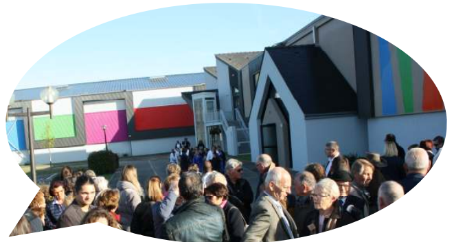
Coupe du ruban et dévoilement de la plaque