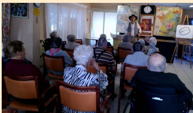
Animation sur « La grande aventure du pain »

Depuis la transformation de la M.A.P.A en E.H.P.A.D., le public accueilli à la Résidence de la Baie et les normes régissant la vie de l'établissement ont profondément évolué. Des travaux s'imposent pour améliorer le service aux résidents, offrir de meilleures conditions d'exercice au personnel et répondre aux exigences du Département et de l'A.R.S. C'est au bureau de maîtrise d'œuvre et d'ingénierie C-MOI (Combourg) que revient le soin de concevoir un projet qui devrait comprendre : la création d'une nouvelle salle de restaurant et un réaménagement de la cuisine, l'aménagement d'une véritable salle d'animation, la restructuration de la partie soins et des bureaux. À suivre dans le prochain numéro, les plans et nouveaux espaces.