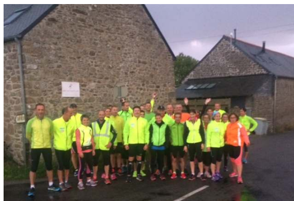
Entraînement collectif sur la commune