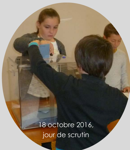
18 octobre 2016, jour de scrutin