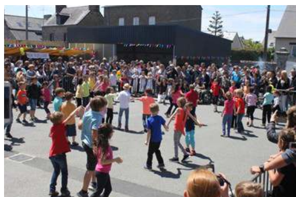
Fête de l'école 2015-2016