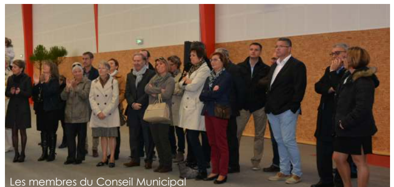
Les membres du Conseil Municipal