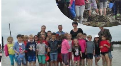
Découverte de la Baie du Mont Saint-Michel