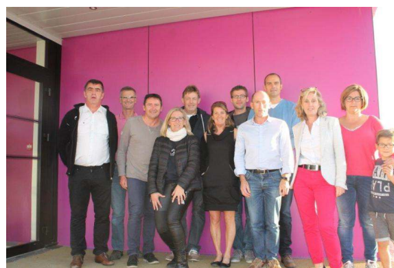
Composition du bureau

Rendez- vous sur la piste du stade : le mardi et le jeudi à 19h et le dimanche à 9h30.