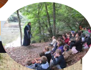
Promenade contée au château de la Roche Jagu et dans la vallée de Traouéros