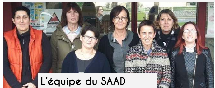
L'équipe du SAAD