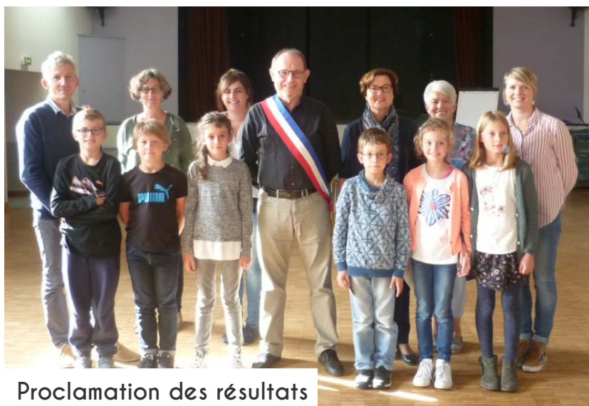
Proclamation des résultats

Rendez-vous est pris devant leurs aînés au mois de mars, en séance, pour la présentation du projet 2018.