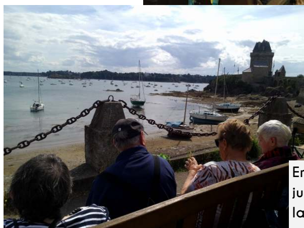
En visite à Solidor en juillet, à l'occasion de la braderie