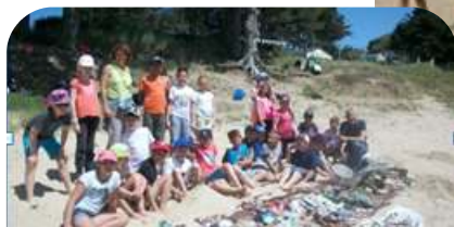
Opération nettoyage et tri des déchets en lien avec le projet Eco-école