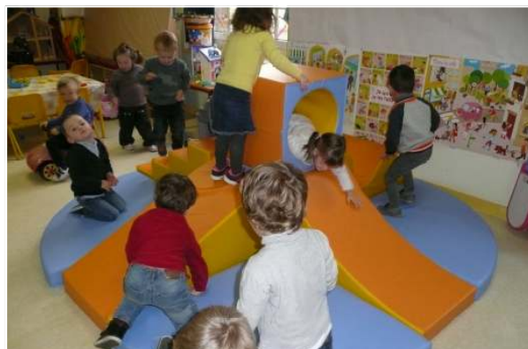
Nouvel équipement dans la classe TPS-PS