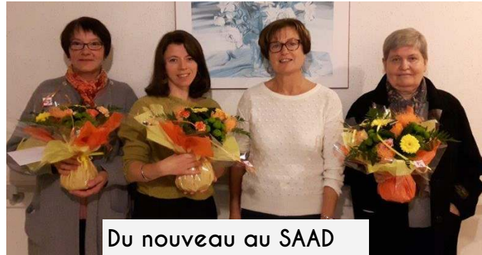
Du nouveau au SAAD