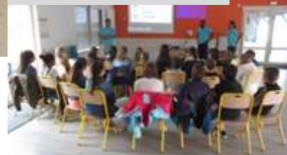
Initiation aux premiers secours