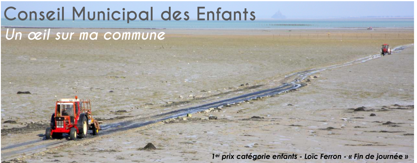
1 er prix catégorie enfants - Loïc Ferron - « Fin de journée »

Chaque année, des projets du conseil municipal des jeunes se concrétisent : installation d'une plate-forme multi-jeux et du skate parc, rencontre avec les aînés, balades à vélos...etc. Pour la saison 2017-2018, il s'agissait d'une chasse à l'œuf à la Vallée verte et d'un concours photo ouvert à tous les Méloriens. Le thème du concours photos était « Ma commune, entre Terre et Mer ». Deux catégories étaient en lice : adultes et enfants. La Municipalité remercie l'ensemble des participants pour la qualité des photographies remises, et notamment pour les angles de vue nouveaux et originaux qu'elles ont révélés sur la commune.