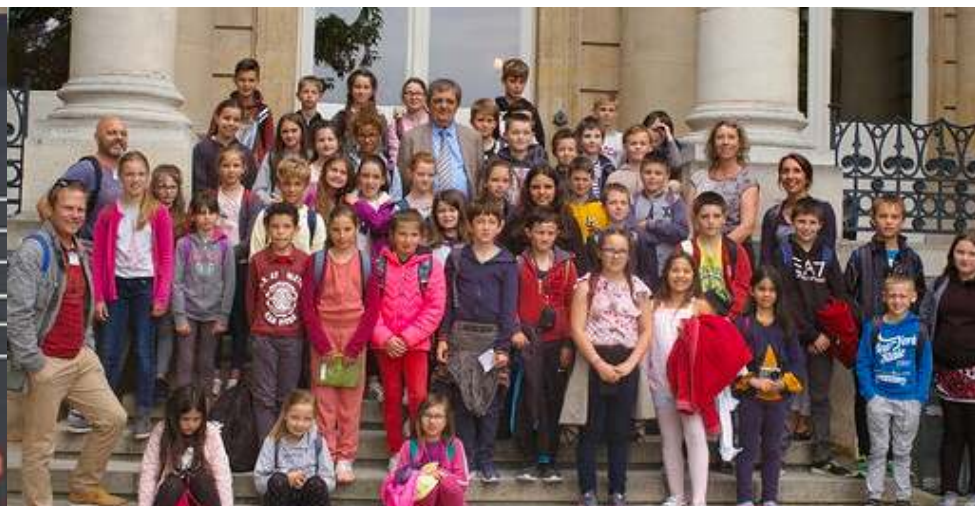
Visite de l'Assemblée Nationale par les élèves de CM1-CM2