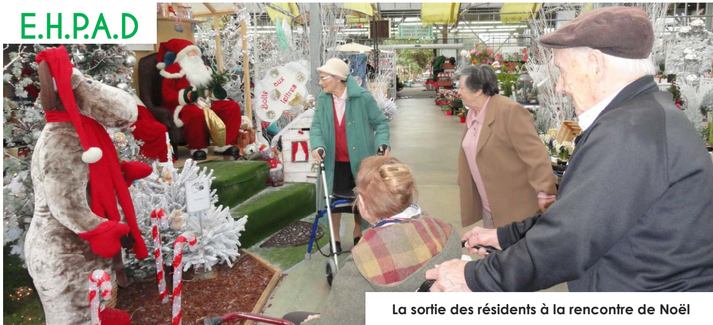
La sortie des résidents à la rencontre de Noël