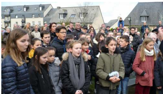
Présence des enfants des écoles aux cérémonies

Ne pas oublier et entretenir la mémoire de tous ceux (civils ou militaires) qui ont sacrifié leur vie au service de la Patrie et pour notre liberté, est la principale vocation de l'Union Mélorienne des Anciens Combattants. C'est dans cet esprit que nous invitons tous les combattants, tous les habitants et notamment, les plus jeunes, les élus, les enfants des écoles, leurs parents et leurs enseignants à assister aux cérémonies officielles du souvenir : « Le devoir de mémoire doit être l'affaire de tous ! ». C'est pourquoi, nous lançons un appel aux anciens combattants non encore adhérents ou nouveaux dans la commune, aux anciens gendarmes, policiers, pompiers, OPEX et soldats de France et citoyens de la paix, à venir nous rejoindre. « Ils seront les bienvenus ! ». Je remercie tous les participants à nos activités, membres ou non de la section. Nous comptons sur vous pour continuer et nous vous adressons nos meilleurs vœux pour la nouvelle année.