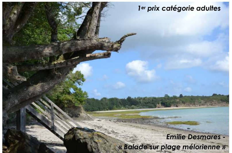
1 er prix catégorie adultes

Chaque année, des projets du conseil municipal des jeunes se concrétisent : installation d'une plate-forme multi-jeux et du skate parc, rencontre avec les aînés, balades à vélos...etc. Pour la saison 2017-2018, il s'agissait d'une chasse à l'œuf à la Vallée verte et d'un concours photo ouvert à tous les Méloriens. Le thème du concours photos était « Ma commune, entre Terre et Mer ». Deux catégories étaient en lice : adultes et enfants. La Municipalité remercie l'ensemble des participants pour la qualité des photographies remises, et notamment pour les angles de vue nouveaux et originaux qu'elles ont révélés sur la commune.