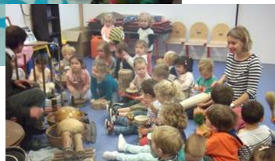
Spectacle de percussions pour les maternelles